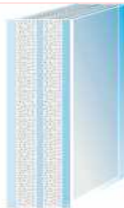
Assemblage Pyrobel Réaction au feu-les intercalaires foisonnent et assurent une barrière contre le feu